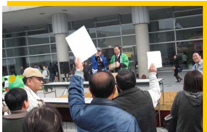
大勢の市民らが参加し、盛り上がるオークション

天候に恵まれ、多くの入場者でにぎわった、第1回の「まつやま農林水産まつり」が、アイテムえひめで盛会のうちに終了しました。初日のオープニングイベントには、開場を待ちわびる市民らの行列ができ、無料で配布された先着順の記念品もあつという間に配り終えられました。 会場は、屋外ブースと屋内のブースで構成されており、農林水産業界のあらゆる団体からの出店が立ち並び、松山離島振興協会や中島漁協、女性部、上怒和地区の海を守る会が、島の特産品を展示販売し、島嶼部のPR活動に努めました。