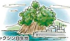
ビヤクシン自生地