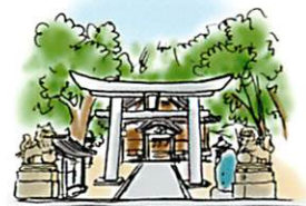
船越和気比賣神社