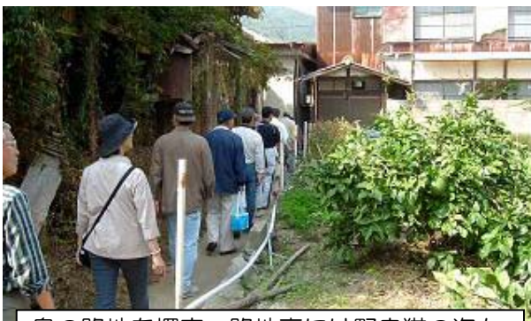
島の路地を探索。路地裏には野良猫の姿も