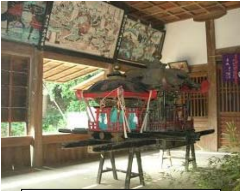
宇佐八幡神社の絵馬堂に 鎮座する大小2体の神輿

松山離島振興協会では、松山市の「坂の上の雲フィールドミュージアム活動支援事業」の採択を受けて、各島の地域資源調査を行っているところですが、その調査の成果を量り、今後の島の活性化の目標値などを設定するための実証実験として、今回、3つの島をめぐる『島めぐりクルージング』を開催しました。