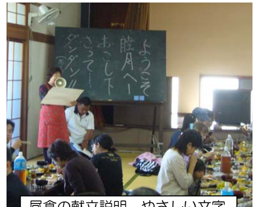
昼食の献立説明。やさしい文字 からも歓迎の意が伝わります