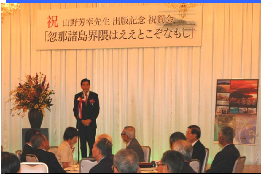
祝賀会では、知事に続き、市長がお祝いのことばを述べられました