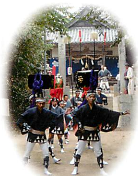
宇和間地区 やっこ振り